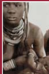
"Donne nel mondo" foto digitale 103 x 74 cm