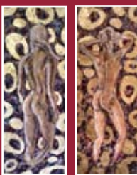
"Sogni d'oro" "Sogni d'oroll" tecnica mista 70 x 28 cm tecnica mista 70 x 28 cm