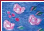
"Acqua e rose" olio su tela 35 x 50 cm