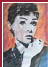
"Raffinatezza" matita e acquarello su carta 33 x 22 cm