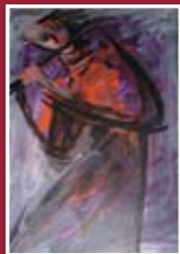
"Flautista" tempera su carta 60 x 40 cm