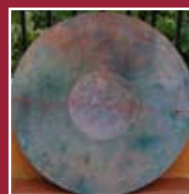
"Battiti Concentrici" olio e pasta modellata su tela e plexiglass diametro cm 80