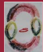
"In un cerchio" linoleografia 70 x 50 cm