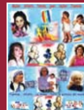
"Tutta la potenza del mondo" tecnica mista 40 x 60 cm