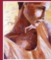
"Luce" olio su tela 40 x 50 cm