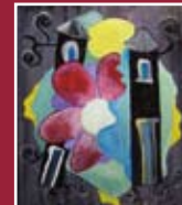
"Maternità" smalti acrilici su tela 50 x 60 cm