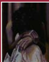
"Solitudine" olio su tela 45 x 55 cm

Azienda Ospedaliero-Universitaria di Careggi