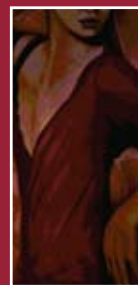
"La Duchessa" olio su tela 40 x 80 cm

Azienda Ospedaliero-Universitaria di Careggi