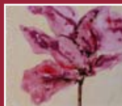
"Orchidea Rosa" smalto e catrame 92 x 103 cm