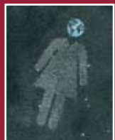
"Terra sostantivo femminile" - acrilico 29 x 21 cm