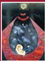
"The birth" lastra in ferro 200 x 100 cm