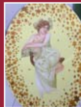
"Giselle" tecnica a olio 50 x 70 cm