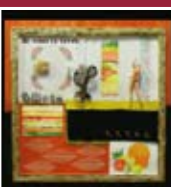
"Ho perso la testa" tecnica mista 110 x 100 cm