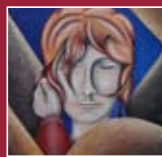
"La carezza" tecnica mista su tela 70 x 70 cm