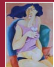
"Attesa" olio su tela 80 x 60 cm