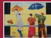
"Thumbs" tecnica mista 80 x 60 cm