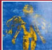
"Angeli" tecnica mista 120 x 120 cm