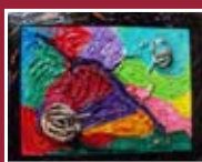
"Maternità: il distacco" tecnica mista 73 x 93 cm