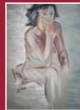
"I pensieri delle donne" gesso e grafite 105 x 76 cm