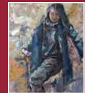
"L'adolescente" olio su tela 80 x 100 cm