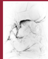
"Maternità III" carboncino 100 x 70 cm