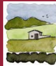
"La casa del pastore" acquarello 21 x 30 cm