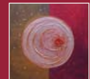
"Sole dentro" tecnica mista su tela 72 x 72 cm