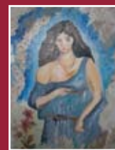
"Lunonis" (La dea del parto) acrilico - terra su tavola 20 x 30 cm