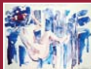
"Donnabosco" acquarello su carta 25 x 35 cm