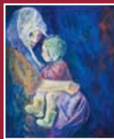
"Maternità" olio su tela 60 x 80 cm

Azienda Ospedaliero-Universitaria di Careggi